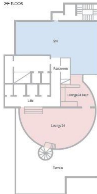
24 th FLOOR